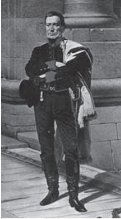
José Gervasio de Artigas: un proyecto alternativo al de los hombres de mayo.

ya como Primera Junta, dispondrá la creación de un ejército cuyo primer cometido será someter a los pueblos del interior del ex-vice-reynato para imponer lo decidido en ... Buenos Aires. De ahí, que a las provincias no envíen diplomáticos para informar y consensuar lo que decidieron los propietarios de Buenos Aires; lo que se envía son fuerzas armadas para imponer al conjunto de las poblaciones los intereses económicos y políticos de una minoría.